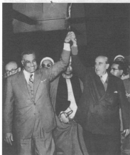
عبد الناصر مع شكري القوتلي